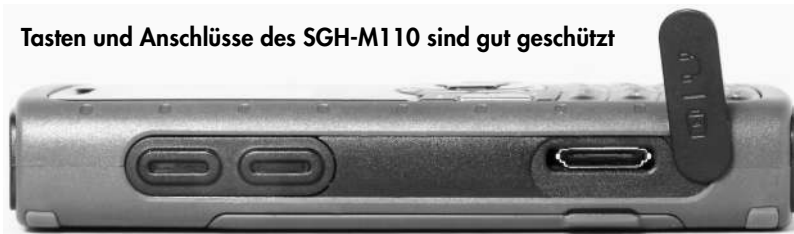
Tasten und Anschlüsse des SGH-M110 sind gut geschützt

das SGH-M110 auch sehr übersichtlich zu bedienen. Es gibt also Recht große Tasten und ist daher für viele Anwender allein aus diesem Grund sympathischer zu bedienen als winzige Design-Handys. Und jene größeren Handys, die unzählige Zusatzfunktionen mit Mehrfachbelegung haben, die – wenn man diese Zusatzfunktionen nicht braucht – einfach nur stören.