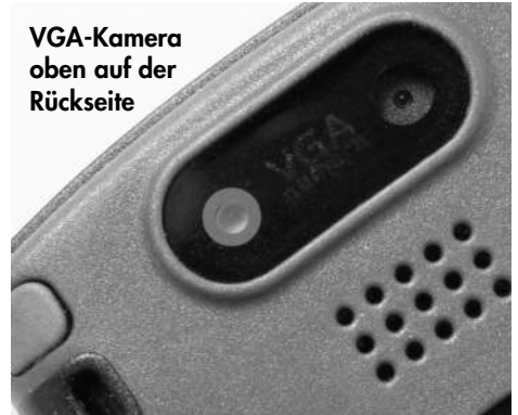
VGA-Kamera oben auf der Rückseite