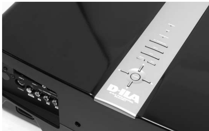
Bedienfeld oben am Projektor mit Cursor-Tasten für Menü-Navigation

tailwiedergabe bei gleichzeitiger Rausch-Reduzierung besonders auch für Videomaterial kleinerer Auflösung