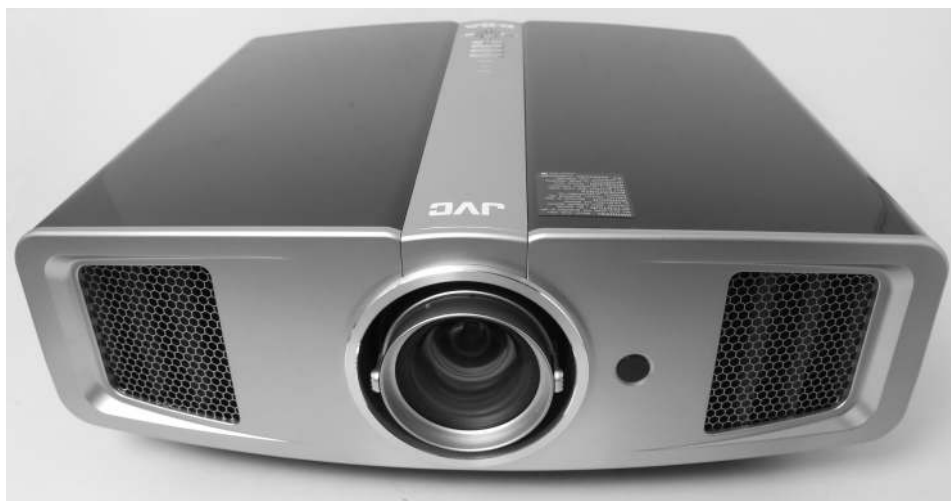
JVC DLA-HD1: HighEnd-Videoprojektor für beste Darstellung von Videos in Full-HD-Qualität über drei D-ILA-Panels mit derzeit bestem Kontrastverhältnis 15000:1

Mit dem D-ILA-Display – das genauso auch in den Rückprojektions-Fernsehern von JVC eingesetzt wird – hat JVC eine hauseigene Technologie. Es handelt sich dabei um ein Auflicht-Display. Bei diesem