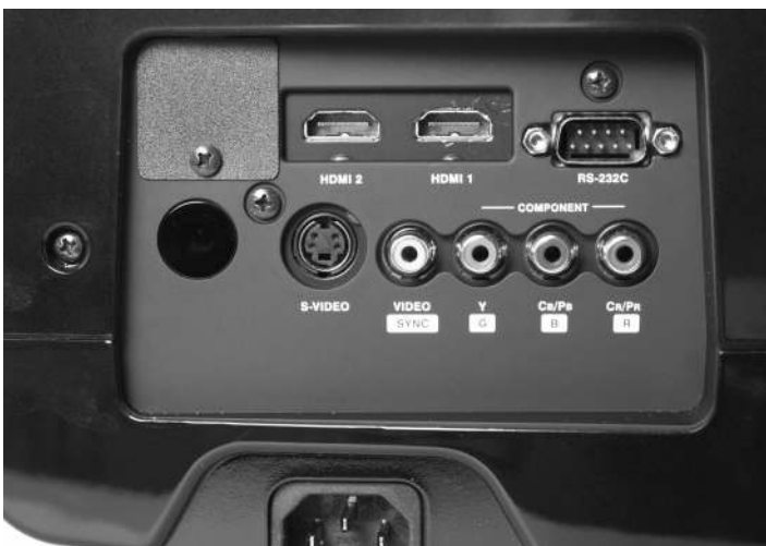
Anschlussfeld auf der Rückseite: Es gibt zwei HDMI-Eingänge