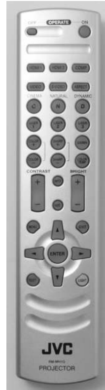
Tasten der Fernbedienung sind im Betrieb hinterleuchtet

Die Anschlussmöglichkeiten decken alle einigermaßen üblichen Signalarten ab. Es kann damit also alles dargestellt werden, was von irgendeiner Videoquelle kommt, inklusive Computer-Bildschirm. Das ist heute auch bei einfacheren Projektoren