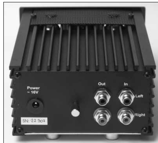
Recht preisgünstige Lösung für guten, lebendigen Klang von der Schallplatte: Phono-Röhren-Vorstufe Pro-Ject TubeBox für MM/MC-Tonabnehmer